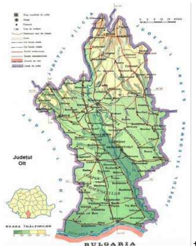
Figura 1: POZITIA GEOGRAFICA A PROIECTULUI

Judetul Olt se afla situat in Regiunea de dezvoltare 4 Sud-Vest Oltenia si are o populatie de 469.637 locuitori (anul 2011). Din punct de vedere administrativ, judetul Olt este compus din 2 municipii (Slatina si Caracal), 6 orase (Bals, Corabia, Draganesti Olt, Piatra Olt, Potcoava si Scornicesti) si 104 comune.